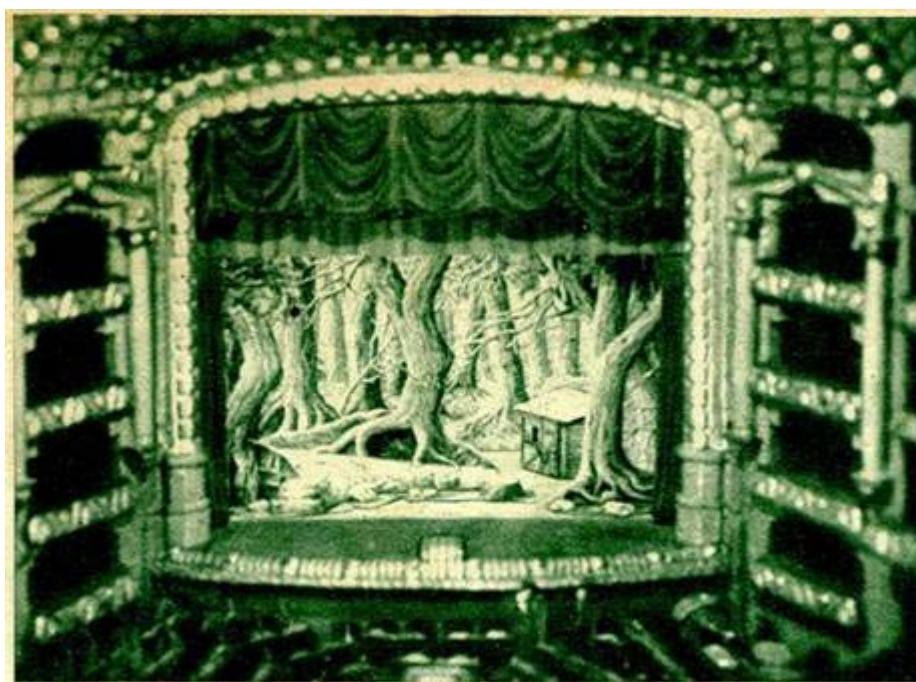
Decorado del prólogo de "La ciudad invisible", de Rimsky Korsakof.

A la pregunta de por cuanto los vendería contestó que a ningún precio ya que sería como poner precio a su propia vida.