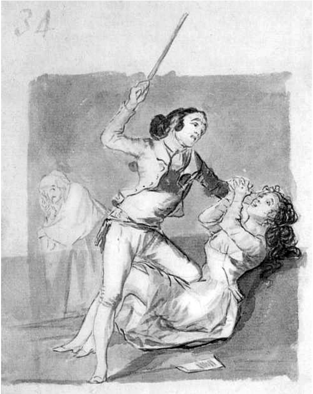
Imagen: Francisco de Goya, Mujer maltratada con un bastón (1796-1797) Álbum B, o de Sanlúcar de Barrameda / Madrid.