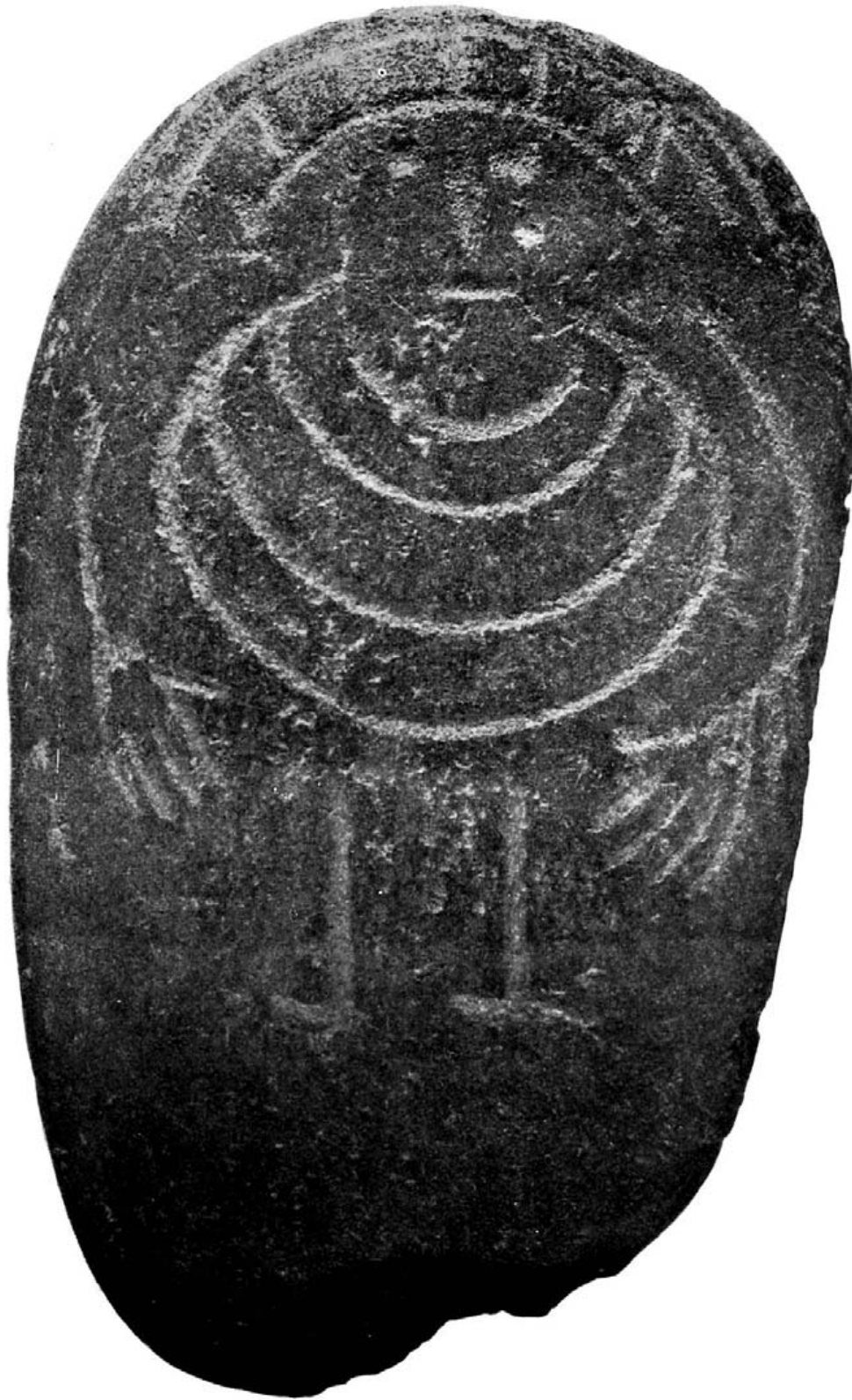
El "ídolo de Ciudad Rodrigo (Salamanca). Museo Arqueológico.