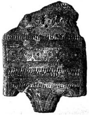
Fig. 3.- Broche de cinturón procedente de Sasamón (Burgos).