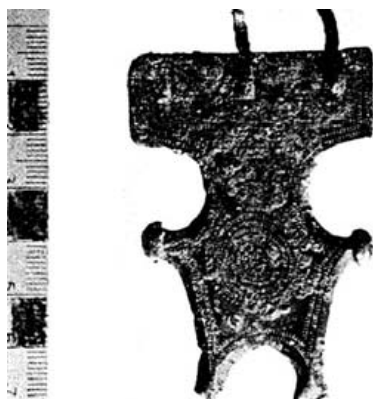
Fig. 1.- Broche de cinturón procedente de Korkyra