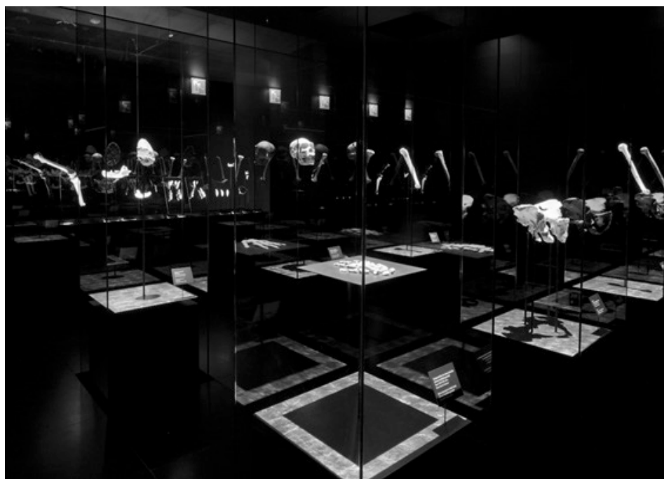
Figura 1. Restos óseos humanos en el interior de la estructura llamada Sima de los Huesos.

En cuanto a los documentos que componen el corpus del análisis, los restos óseos encontrados en los yacimientos, debemos prestar especial atención a su situación dentro del Museo. El Museo de la Evolución Humana presenta en su planta -1, la primera en el dispositivo, tres grandes estructuras o cubículos que representan la Sierra de Atapuerca y las secciones de tierra donde comenzaron las excavaciones. Cada cubículo representa una cavidad que aloja en su interior los restos óseos que se hallaron en ellas. Esta relación de contenido (documentos) y continente (cubículo) se concreta en el soporte de estos restos a los que presenta. Hay una diferencia notable entre la presentación de los restos hallados en los yacimientos de Atapuerca y los contenidos en los que se apoya el museo, y que incluye en su discurso para hacer posible la divulgación del conocimiento científico. Por una parte, los restos óseos se presentan de una forma individualizada, de tal manera que cada hueso o conjunto de huesos está alojado en su propia vitrina y separado de los demás en el interior de los cubículos.