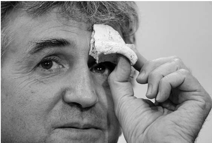
Figura 4. Juan Luis Arsuaga durante la rueda de prensa.

Podemos señalar algunos ejemplos sobre el trasvase de estrategias realizado en el discurso del museo a través del documento. Uno de estos ejemplos ocurrió cuando, sirviéndose del documento, durante una rueda de prensa Juan Luis Arsuaga, uno de los directores científicos de las excavaciones y del museo, colocó un hueso recién hallado sobre su ceja para explicar qué parte del homínido habían hallado.