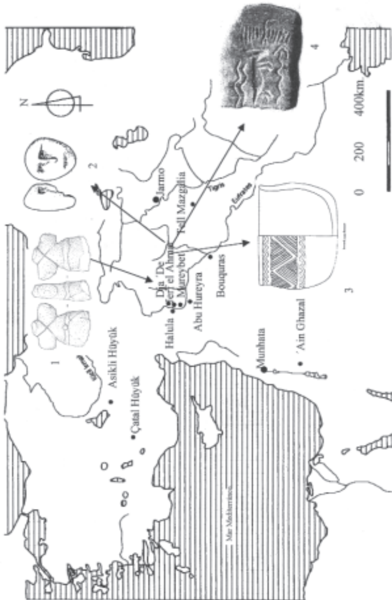
Figura 3. Mapa de los principales asentamientos del PPNA y PPNB del Próximo Oriente. Objetos pertenecientes a Dja' de (Siria) 1. torso de cuerpo humano; 2. careta humana de piedra; 3. cuenco de piedra con decoración geométrica; 4. plaquita con decoración serpentiforme (a partir de Stordeur, 2000).