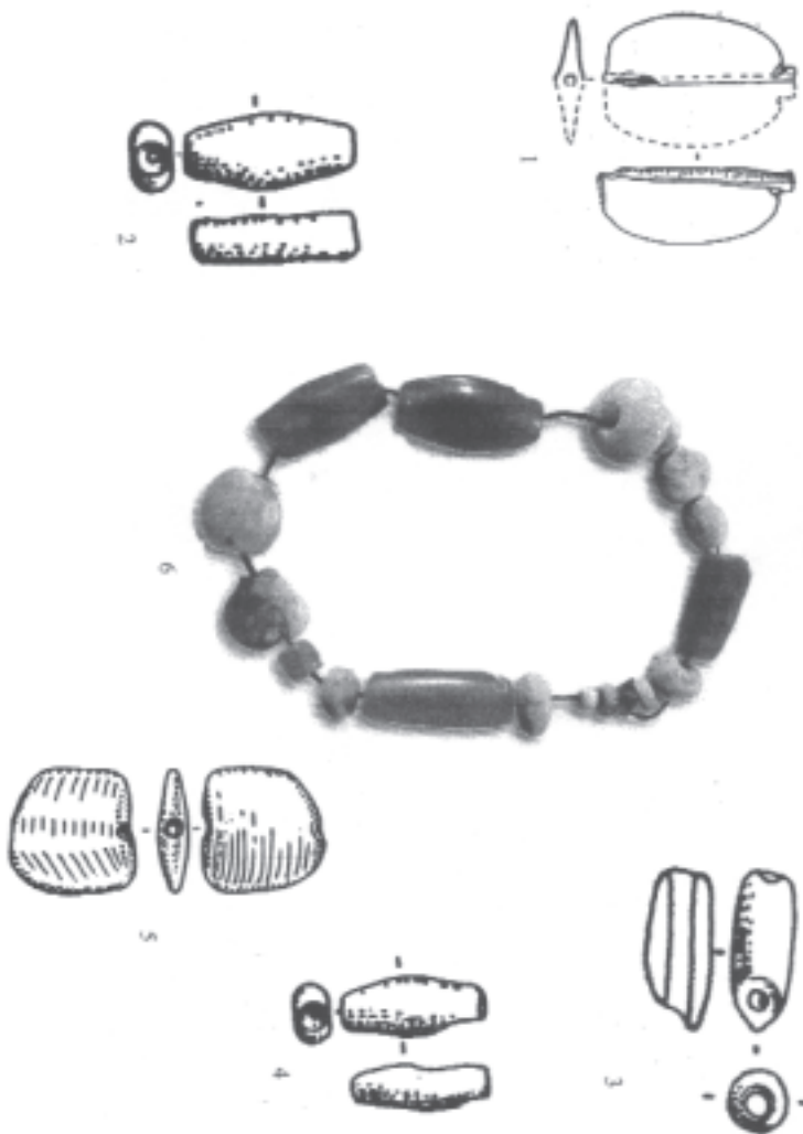
Figura 2. Diversos cuentas de adorno de tell Halula (Siria) 1. tipo mariposa. 2 y 4. tipo tonelete; 3. tipo cilíndrico; 5. tipo aplanado (a partir de Molist et alii , 1996, 131). 6. Reconstrucción de un collar.