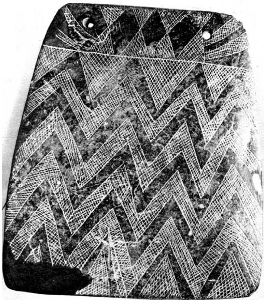
Fig. 4.— Museo Arqueológico Nacional.— Ídolo-placa oculado, de pizarra de color gris verdoso.