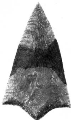
Fig. 5.— Museo Arqueológico Nacional.— Alabarda fragmentada de sílex, de fina talla bifacial.

25. Alabarda fragmentada de sílex gris claro de forma trianguliforme con dos muescas cóncavas en su base. La talla de sus bordes es muy fina, [-9→10-] constituyendo una pieza excepcional por su perfección técnica. Mide 170 mm. de longitud, 98 mm. de anchura y 7 mm. de grueso en la parte central (Fig. 5).