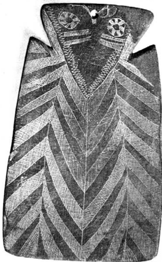
Fig. 2.— Museo Arqueológico Nacional.— Ídolo-placa de pizarra gris oscura.

2. Placa de pizarra de color gris oscuro. Sus dimensiones son 210 mm. x 125 mm. de longitud y anchura respectivamente y 11 mm. de espesor. Se presenta mutilada en el ángulo superior de la cabeza, y en el hombro de este mismo lado que es el izquierdo del ídolo (Fig. 2). [-5→6-]