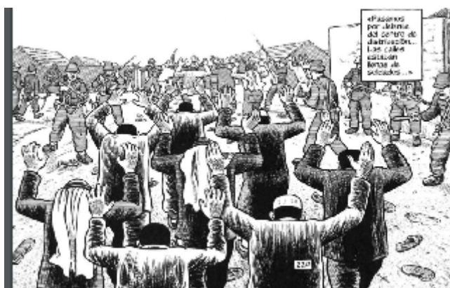
Figura 1. Hombres caminando de espaldas (2009: 220)

sin espacios entre ellos. En las páginas 220 y 221 (2009: 220-221) Sacco va integrando nuevas técnicas. Hace un giro en la perspectiva y baja a nivel de los cuerpos concretos. Esta vez se trata de un encuadre medio pero desde la espalda de un grupo de hombres caminando con sus manos alzadas. Las manos alzadas y la cabeza gacha será la imagen que más se repetirá, convirtiéndose en una condición corpórea. Sin embargo, la viñeta en cuestión exagera la colectividad mediante la disposición grupal en forma casi de triángulo en la que los hombres se forman unos sobre otros. Sacco monta las manos de los hombres sobre las espaldas y cabezas de los que les preceden y se refuerza la sensación de batallón inseparable. En esta viñeta ya se anuncia sutilmente la opción final de Sacco de involucrar al lector en esa marcha mortal. Gracias a la perspectiva de espaldas, el lector parece ir siguiendo al grupo de hombres.