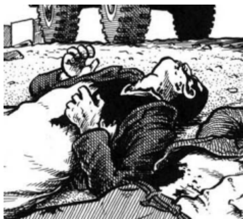
Figura 4. Manos agarrotadas (2009: 334)

Una de las técnicas preferidas en la representación de los cadáveres es la de mostrar los cuerpos enteros. La postura suele ser la de cuerpos que yacen tendidos en el suelo y se ven los rostros de los muertos. Muchos rostros conservan como rictus final en la boca la señal del dolor extremo. A veces boca arriba, otras, boca abajo mostrando las heridas a bala y la sangre chorreante. Llama la atención el uso de las manos y su singular expresión.