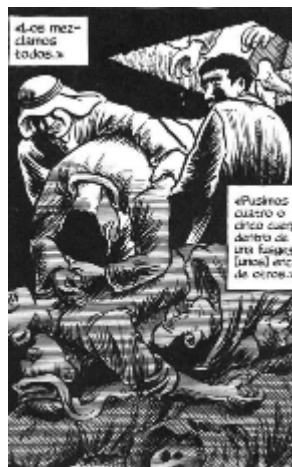
Figura 5. Cuerpos son bajados a la sepultura (2009: 358)

ampliamente trabajado en la pintura del descendimiento de Cristo de la cruz. Hay juego de luz y sombras y hay una complicidad de cuerpos entre los que descienden y los que son descendidos.