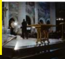
Vivadi Senza Fine

conseguir transmitir el misterio, la mejor definición de las situaciones y los personajes.