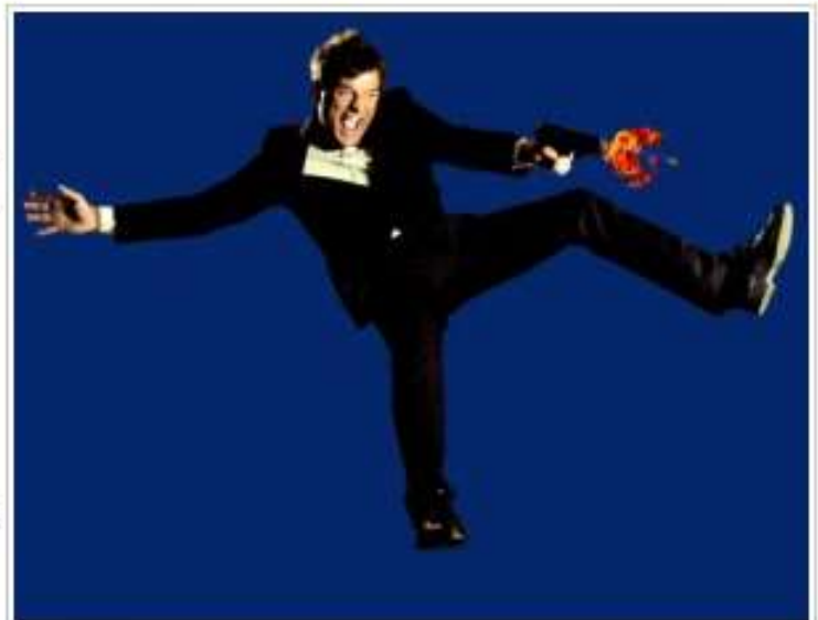
Raúl Cano de vida a ' Action Man ', hasta el lunes 13 en Teatro Arbolé.

Una obra dirigida a todos los públicos que desde el primer minuto hará que las carcajadas fluyan durante todo el espectáculo. Muy recomendable.