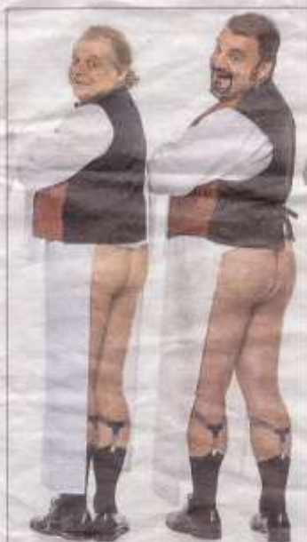
Dos de los actores durante el 'show'.

Fue hace 10 años o más, en el Alfil, Lo mejor de Monty Python . Y quizá por aquella querencia el otro día me planté en el teatro de la calle Pez en vez de ir al Calderón para ver el remake , la reposición o como lo quieran llamar de los nuevos Monty. A fin de cuentas el Alfil es como la sede de Yllana y sitio familiar también de Imprebis. Llegué al Calderón con el tercer aviso gracias a la pericia de un taxista volador. ¡Qué emoción por las calles de Madrid! Mis acompañantes y yo