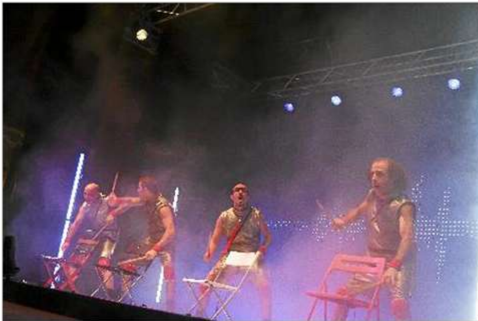
'Sensormen', en uno de sus numerosos momentos álgidos.

La Voz de Almería [ 05/08/2012 - 07:00 ]